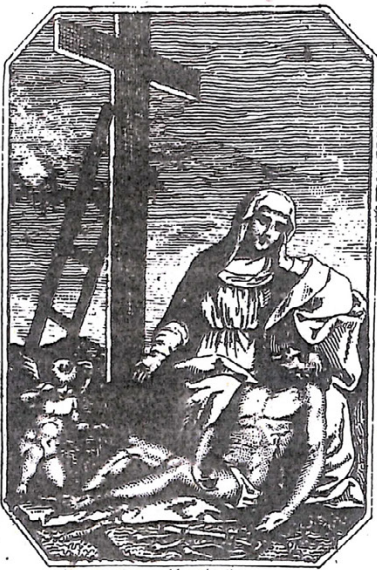
Videte sicut dolor sicut dolor meus

Chiunque andasse alla preghiera per un motivo diverso di quello di fare un'esperienza meravigliosa dell'Amore di Dio e del prossimo, ha sbagliato indirizzo.